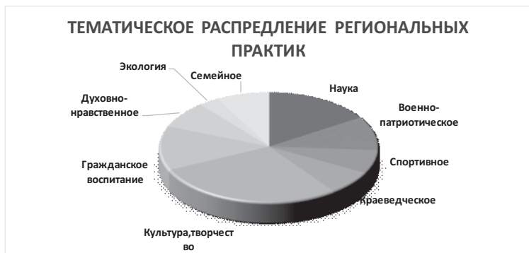
Рисунок 3. Тематическое распределение воспитательных практик в субъектах Российской Федерации