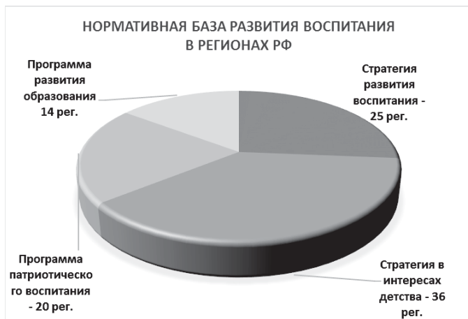
Рисунок 1. Нормативная база развития воспитания в регионах России

Нормативные документы приняты следующими субъектами власти в регионах Российской Федерации (см. рис. 2).